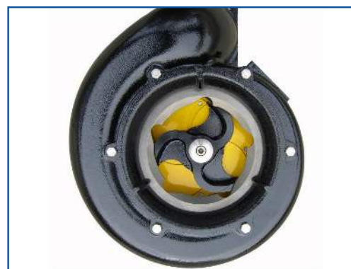
Pumpehus i støbejern med knivskær